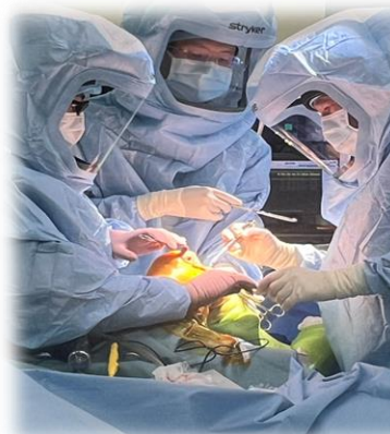
〔過去5年間の手術件数〕

外来診療は、月・火・木・金曜日の午前中に行っております。(※急患に関してはこの限りではありません)紹介制ではございませんのでお困りの患者様がいらっしゃればお気軽にご相談ください。