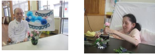
父の日のプレゼントを作りました。ご本人さんのお誕生日に作ったので、自分へのプレゼントのようにも見えます(^_^;)

県のリスクレベルの見直しにより、一度は開所できたものの、感染者が今まで以上に多くなり、また、院内においてクラスターが発生したため、余儀なく閉所せざる負えなくなり、利用者様、ご家族には多大なるご迷惑をおかけし、誠に申し訳ございません。皆様に安心、安全に通所のご利用をして頂けるようにスタッフ一同、感染対策、体調チェック等、しっかりしていきたいと思っております。開所までしばらくお待ちください。